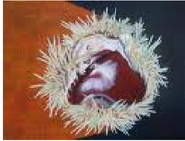
dit is een kastanje in een bolster