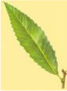
dit is een blad van de boom